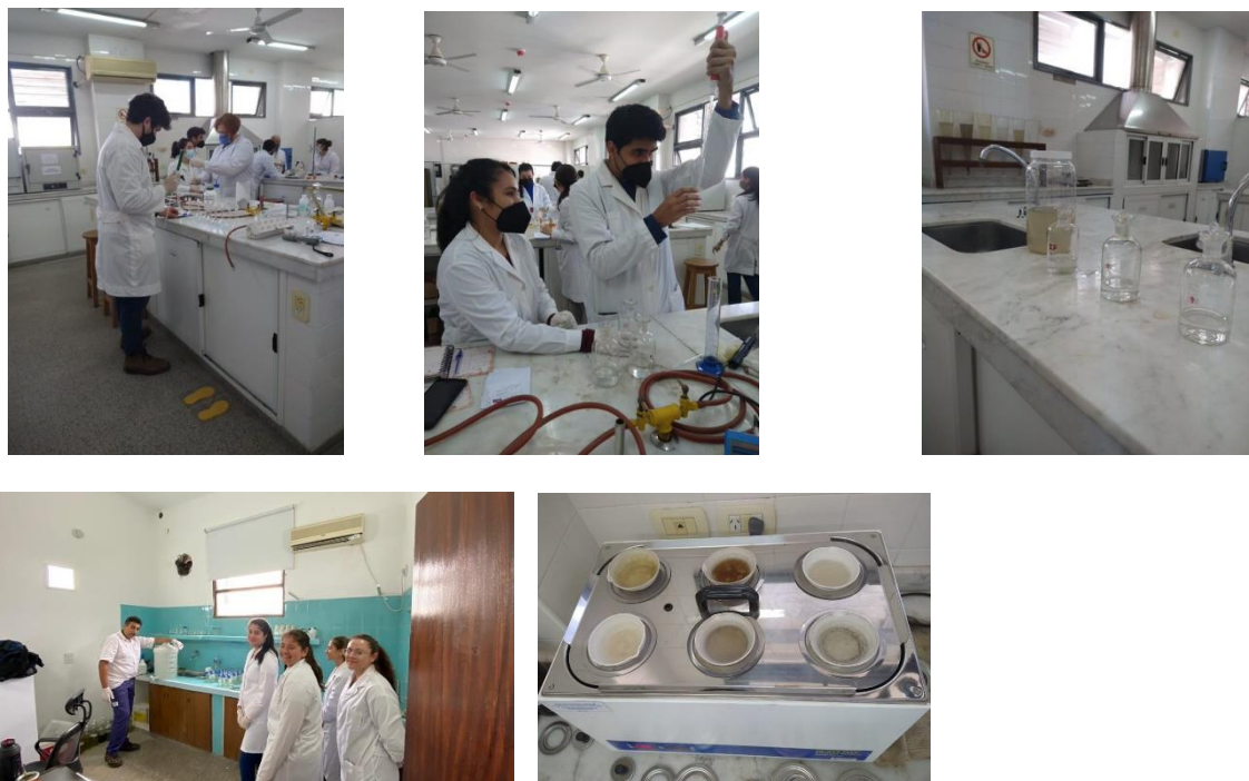
Figura N°3: Realización de los análisis en el laboratorio

Las muestras fueron procesadas en el laboratorio por los alumnos participantes del proyecto y con el seguimiento de los docentes (Figura 3)