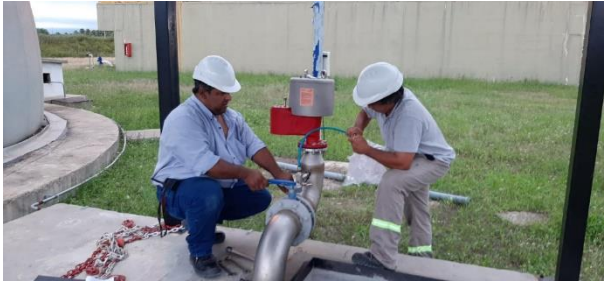
Figura N°8: Toma de muestra de biogas

De la evaluación de los resultados de los análisis se puede concluir que el biogás generado no tiene la concentración esperada de metano, por lo que sería conveniente hacer un seguimiento de este para poder evaluar correctamente su calidad.