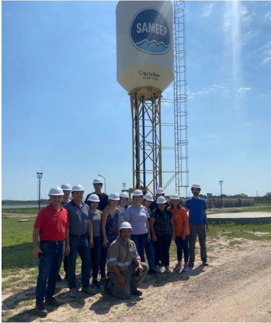
Figura N°6: Visita a Planta de tratamiento de Resistencia - Chaco

Se tomaron muestras de manera sistemática semanal, las que fueron procesadas en el laboratorio de la Cátedra Química Aplicada y en el laboratorio del Grupo de Investigación GISTAQ por los alumnos participantes del proyecto y con el seguimiento de los docentes (Figura 7)