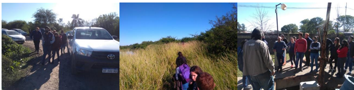
Figura N°1: Visita a las Lagunas de Estabilización de la ciudad de Fontana-Chaco

Se trabajó sobre las lagunas de estabilización de la ciudad de Fontana, Chaco y se realizaron visitas para la inspección visual de las mismas y para decidir los puntos de muestreo (Figura 1).