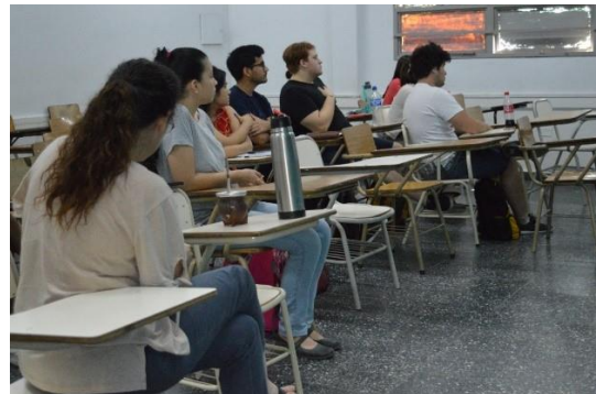
Figura N°4: Capacitación en extensión universitaria

Respecto al área de comunicación llevada adelante por alumnos y profesor de la Cátedra de Seminario de Práctica Profesional de Licenciatura en Comunicación Social de la Facultad de Humanidades de la UNNE, se realizaron las siguientes actividades: