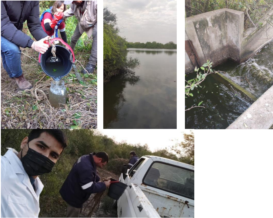
Figura N°2: Toma de muestras en los distintos puntos

Se tomaron muestras de manera sistemática semanal (Figura 2)